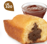
BIJOU CACAO 20 emballages individuels - 680 g DDM* : 2 mois