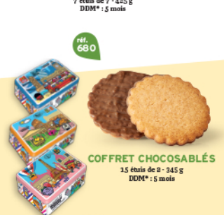
COFFRET CHOCOSABLÉS 15 étuis de 2 - 345 g DDM* : 5 mois