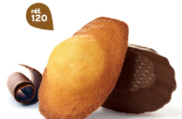
MADELEINES CHOCHOIR 50 emballages individuels - 1080 g DDM* : 2 mois