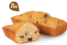
CAKES FRUITS 20 emballages individuels - 600 g DDM* : 2 mois