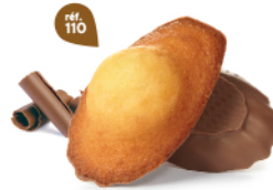
MADELEINES CHOCOLAIT 50 emballages individuels - 1080 g DDM* : 2 mois