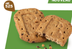
P'TIT-DEJ CHOCOCROUSTILL' 24 étuis de 2 - 670 g DDM* : 5 mois