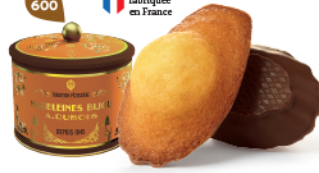
BOÎTE COLLECTOR MADELEINES CHOCHOIR 18 emballages individuels - 280 g DDM* : 2 mois