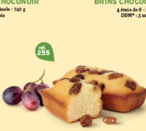
CAKES RAISINS 30 emballages individuels - 900 g DDM* : 2 mois