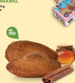
MADELEINES MIEL CANNELLE 20 emballages individuels - 260 g DDM* : 2 mois