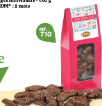
FRITURES CHOCOLAIT Pochette - 150 g DDM* : 10 mois