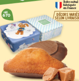
COFFRET MADELEINES CARAMEL CHOCOLAIT 18 emballages individuels - 390 g DDM* : 2 mois