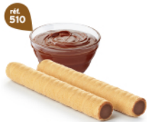
ROLINETTES CHOCHOISSETTES 45 étuis de 2 - 575 g DDM* : 5 mois