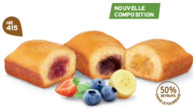
PANACHÉ DE BIJOU FRUITS 30 emballages individuels - 900 g 10 Bijou Fraîse, 10 Bijou Myrtille, 10 Bijou Banane DDM* : 2 mois