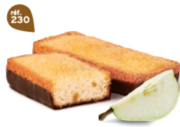
LINGOTS POIRE CHOCHOIR 25 emballages individuels - 675 g DDM* : 2 mois