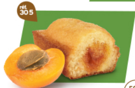
BIJOU ABRICOT 20 emballages individuels - 680 g DDM* : 2 mois