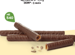
BRINS CHOCOCARAMEL 4 étuis de 6 - 280 g DDM* : 5 mois