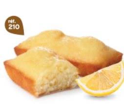
FONDANTS CITRON 30 emballages individuels - 660 g DDM* : 2 mois