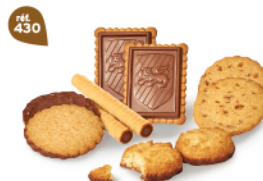
MÉLI-MÉLO DE BISCUITS 48 étuis de 2 - 900 g 8 étuis de 2 Rolinettes Chochoisettes - 10 étuis de 2 Craquants CocoLait 10 étuis de 2 ChocoSablés - 10 étuis de 2 Galettes Caramel d'Irigny 8 étuis de 2 Petit-Bonheur Tablette Chocolat DDM* : 5 mois