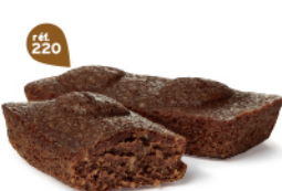
MOELLEUX CHOCOLAIT 30 emballages individuels - 960 g DDM* : 2 mois