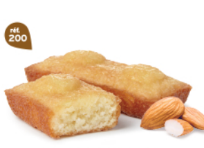
FINANCIERS AMANDES 30 emballages individuels - 660 g DDM* : 2 mois