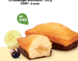
BIJOU BANANE CHOCHOIR 20 emballages individuels - 740 g DDM* : 2 mois