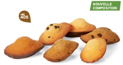
FARANDOLE DE MADELEINES 30 emballages individuels - 575 g 5 Madeleines Chochoir - 5 Madeleines Pépites - 5 Madeleines Citron - 5 Madeleines ChochoPistache - 5 Madeleines Noix de coco Pépites - 5 Madeleines Caramel Chocolait DDM* : 2 mois