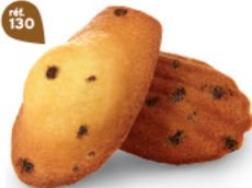
MADELEINES PÉPITES 50 emballages individuels - 900 g DDM* : 2 mois