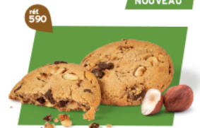
TRÉSOR NOISETTECHOCO 18 étuis de 2 - 585 g DDM* : 5 mois