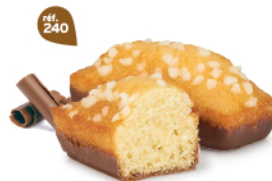
GÉNOIS CHOCOLAIT 30 emballages individuels - 920 g DDM* : 2 mois