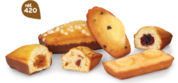
BOUQUET DE PÂTISSERIES 30 emballages individuels - 850g 5 Madeleines Pépites - 5 Génois Chocolait - 5 Bijou Caramel Chocolait 5 Bijou Myrtille - 5 Financiers Amandes - 5 Cakes Fruits DDM* : 2 mois