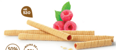
BRINS FRAMBOISE 7 étuis de 2 - 585 g DDM* : 5 mois