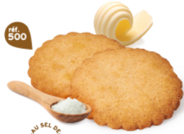
GALETTES 48 étuis de 2 - 880 g DDM* : 5 mois