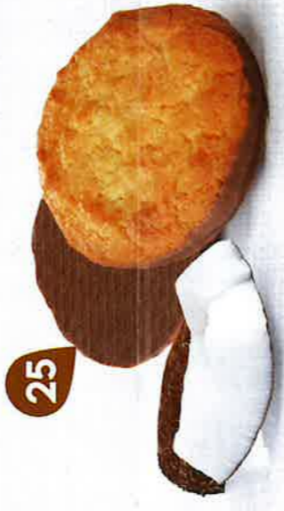
SABLÉS COCOLAIT 24 étuis de 2 - 480 g DDM* : 5 mois