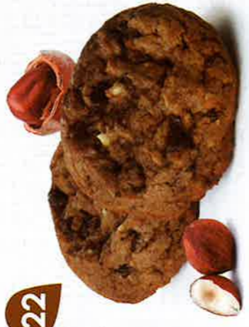
COOKIES CHOC LAIT NOISETTES 24 étuis de 2 - 850 g DDM* : 5 mois