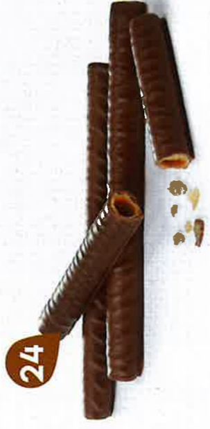
BRINS DE CHOCOCARAMEL 4 étuis de 6 - 280 g DDM* : 5 mois