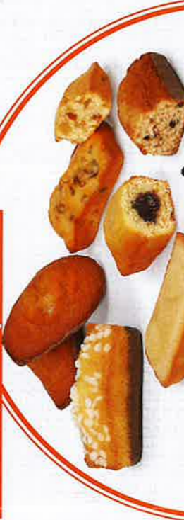
ASSORTIMENT DE PÂTISSERIES 30 sachets fraîcheur - 825 g - 5 ChocoPépites & ChocoLait - 5 Génomis ChocoLait - 5 Madeleines ChocoLait Caramel DDM* : 2 mois