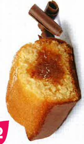
BIJOU CARAMEL CHOC LAIT 20 emballages individuels - 740 g DDM* : 2 mois