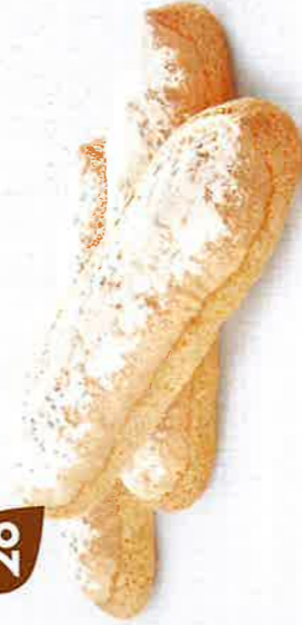
BISCUITS CUILLERS 10 étuis de 6 - 400 g DDM* : 5 mois