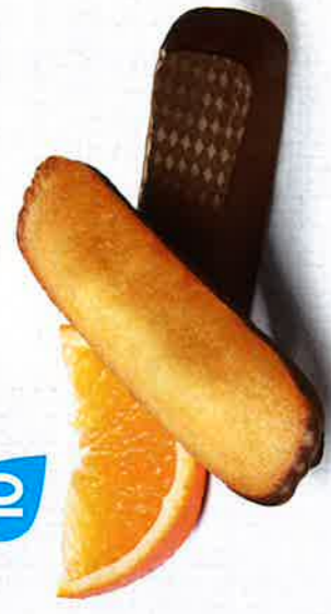
LONGUES CHOCNOIR ORANGE 20 étuis de 2 - 600 g DDM* : 2 mois