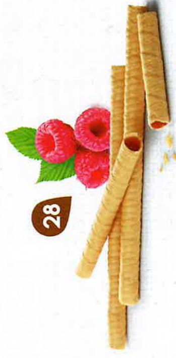
BRINS DE FRAMBOISE 7 étuis de 7 - 425 g DDM* : 5 mois

Moins de 3% de matières grasses 50% de framboises 50% de framboises