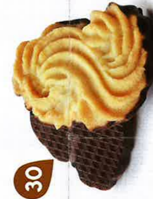
SABLÉS VIENNOIS 32 étuis de 2 - 620 g DDM* : 2 mois