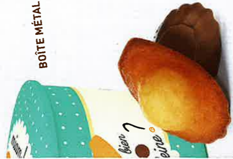
BIJOU CARAMEL CHOC LAIT 20 emballages individuels - 260 g DDM* : 2 mois