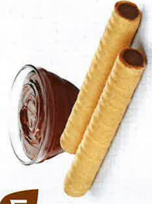
CIGARETTES CHOC LAIT NOISETTES 45 étuis de 2 - 575 g DDM* : 5 mois