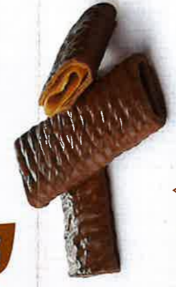
MINI CRÊPES CHOC LAIT 4 barquettes fraîcheur de 18 crêpes 370 g DDM* : 5 mois