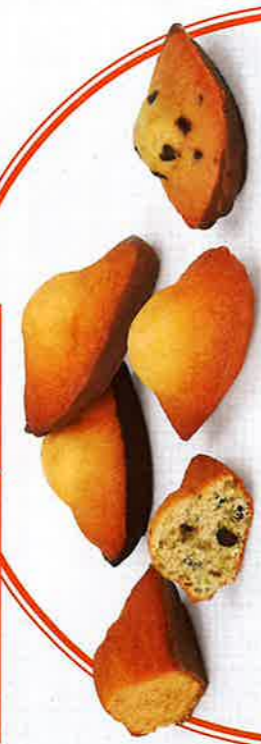
FARANDOLE DE MADELEINES 30 sachets fraîcheur - 610 g - 5 Madeleines Nature - 5 Madeleines ChocoLait - 5 Madeleines ChocoNoir DDM* : 2 mois